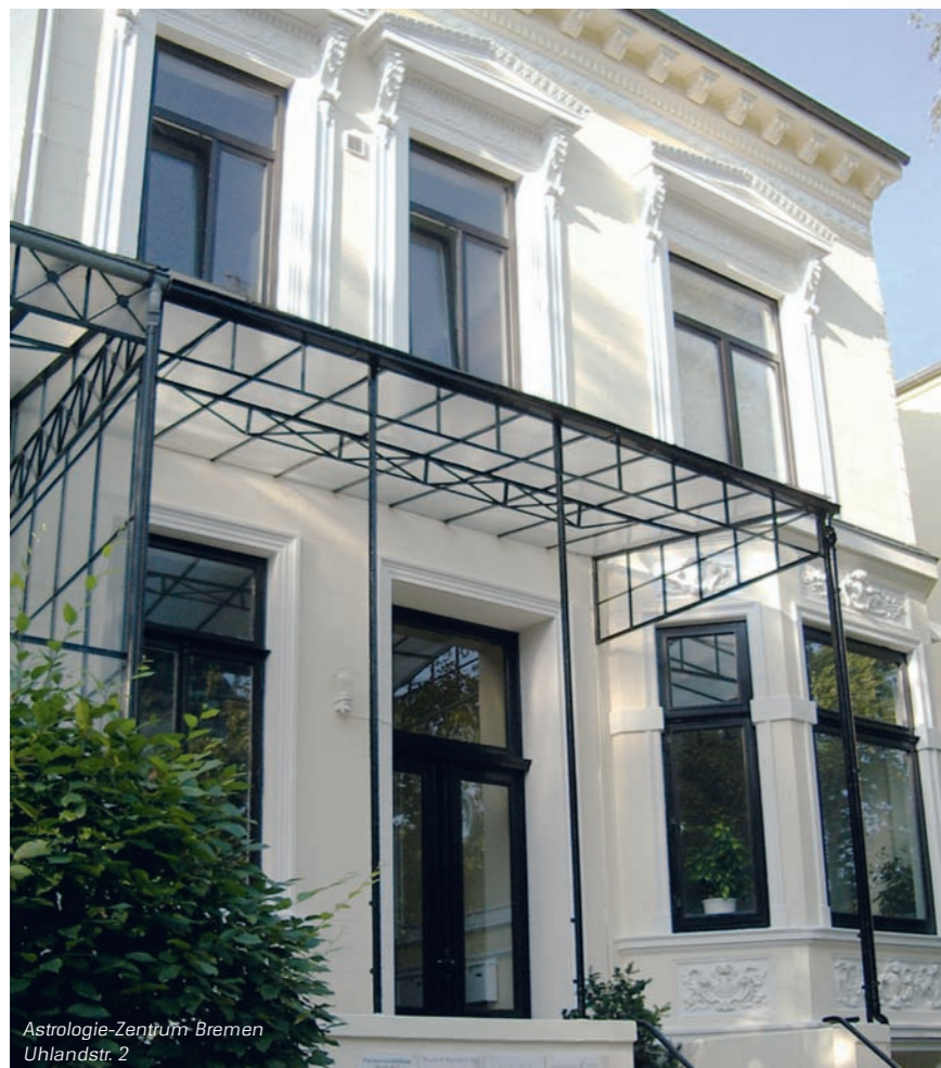
Astrologie-Zentrum Bremen Uhlandstr. 2

Astrologie-Zentrum Bremen Uhlandstr. 2, 28211 Bremen Tel. 0421 - 70 08 70 Fax 0421 - 70 08 88 info@astrologie-zentrum-bremen.de